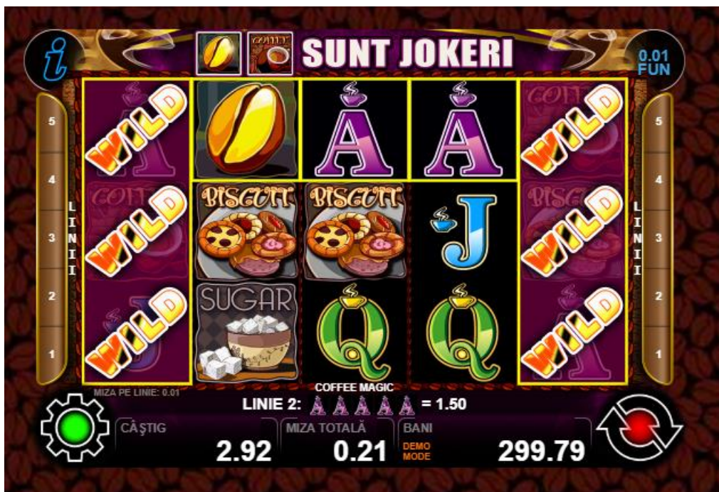
Fig. 4 Ecranul jocului gratuit