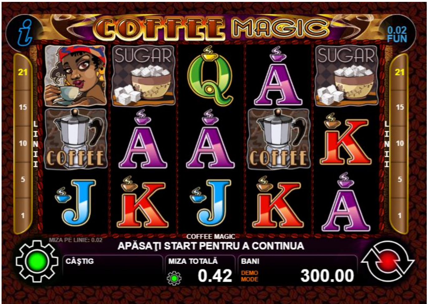
Fig. 1 Ecranul jocului principal