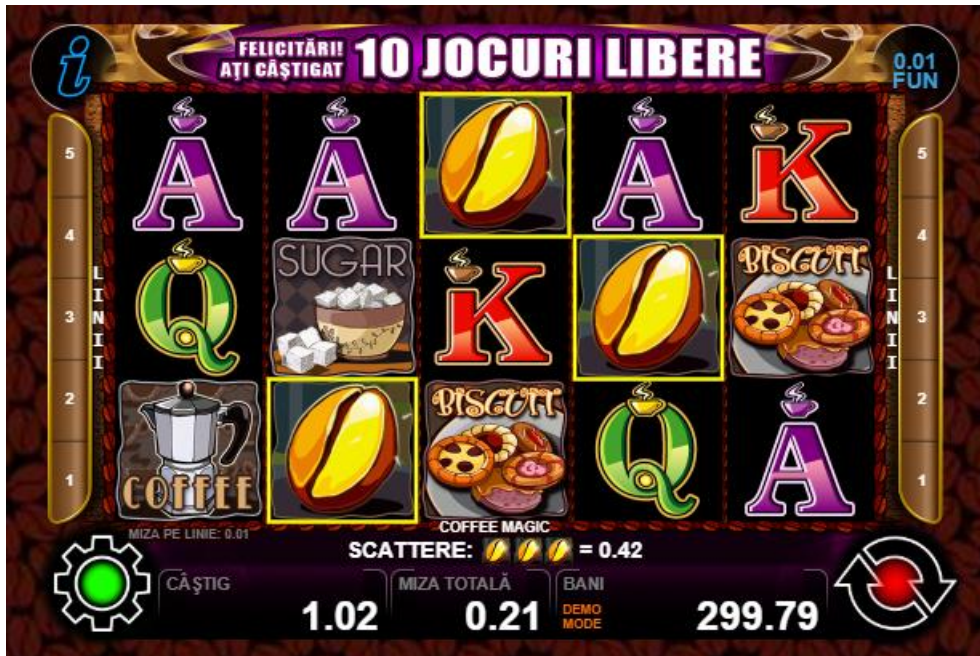
Fig. 3 Ecranul pentru începerea jocurilor gratuite– alegerea unui simbol suplimentar de substituire.

toate celelalte simboluri pe rolă, c cu excepția simbolului „ Boabă de cafea ” (simbol scatter). Fiecare scatter care apare pe ecran în timpul jocurilor gratuite oferă un câștig suplimentar egal cu pariul total.