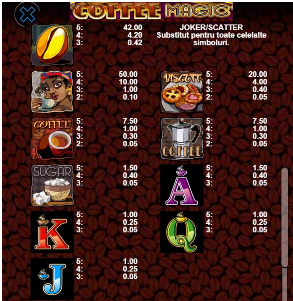
Fig. 2 Tabelul câștigurilor