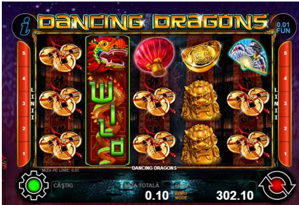
Fig. 3 Ecran de joc cu simbol de substituire pe întreaga rolă de tip „expanded”

Simbolul scatter „Pagodă” – apare pe role 1, 3, 5; 3 simboluri „Pagodă ” participă în formarea câștigului scatter până la de 20 de ori pariul total.