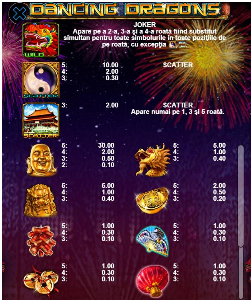
Fig. 2 Tabelul câștigurilor