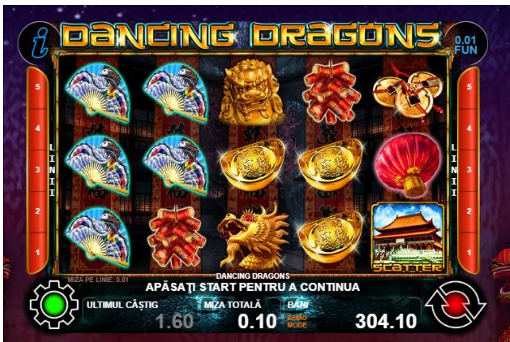
Fig. 1 Ecranul jocului principal