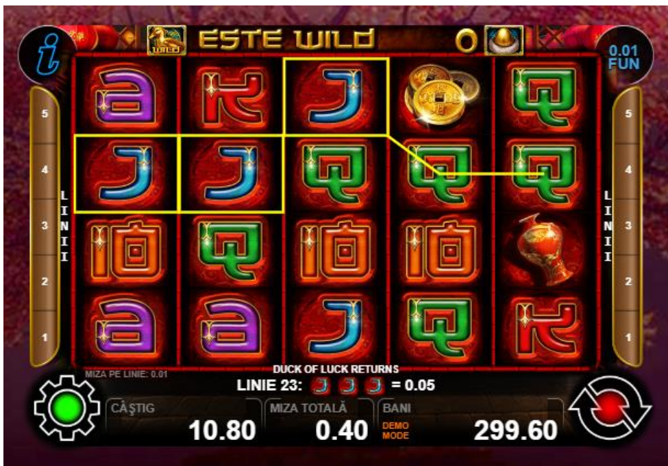
Fig. 3 Ecranul jocului gratuit

Combinatie pentru un câștig maxim pe linie – 5 simboluri „Femeie” pe linia activă oferă un câștig maxim pe linie.