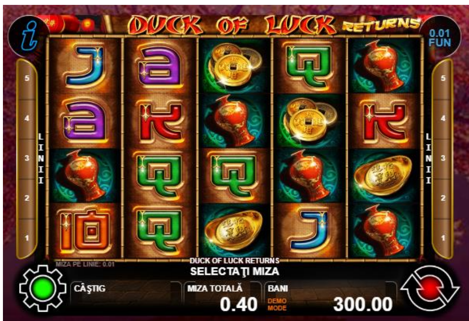
Fig. 1 Ecranul jocului principal