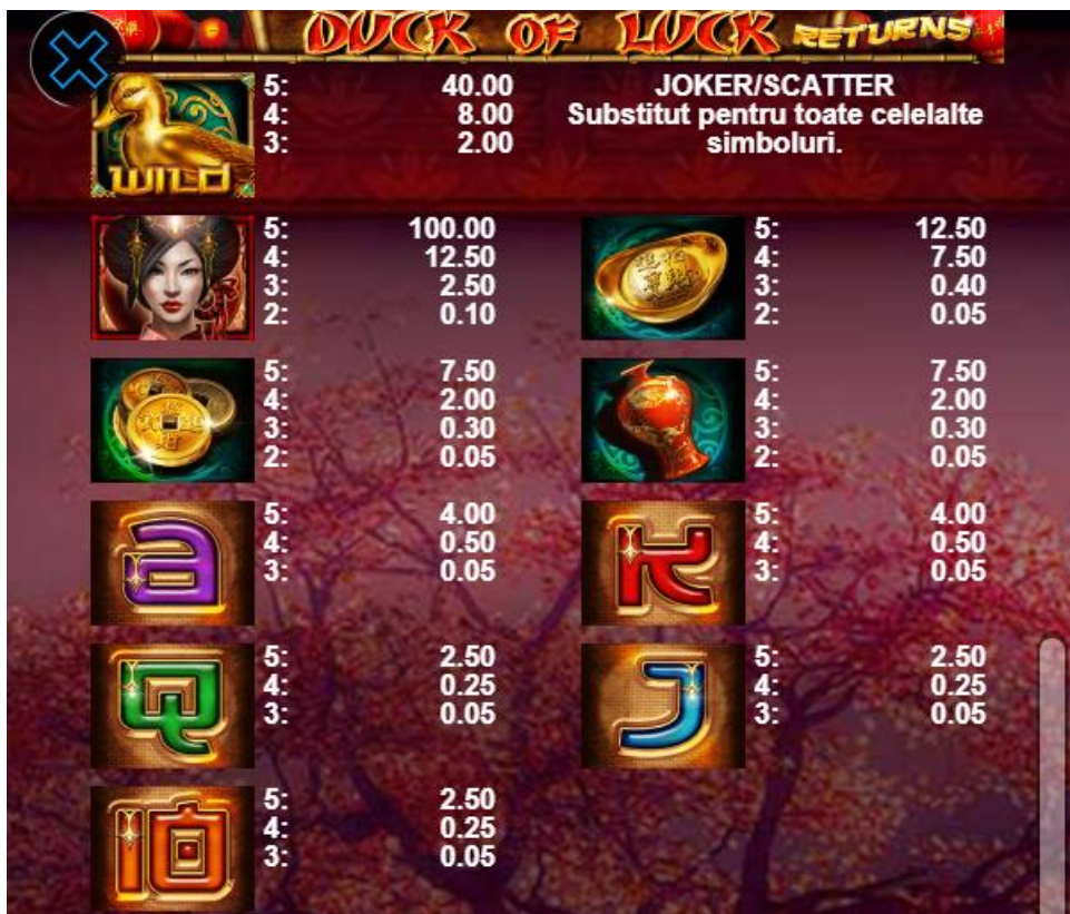
Fig. 2 Tabelul câștigurilor