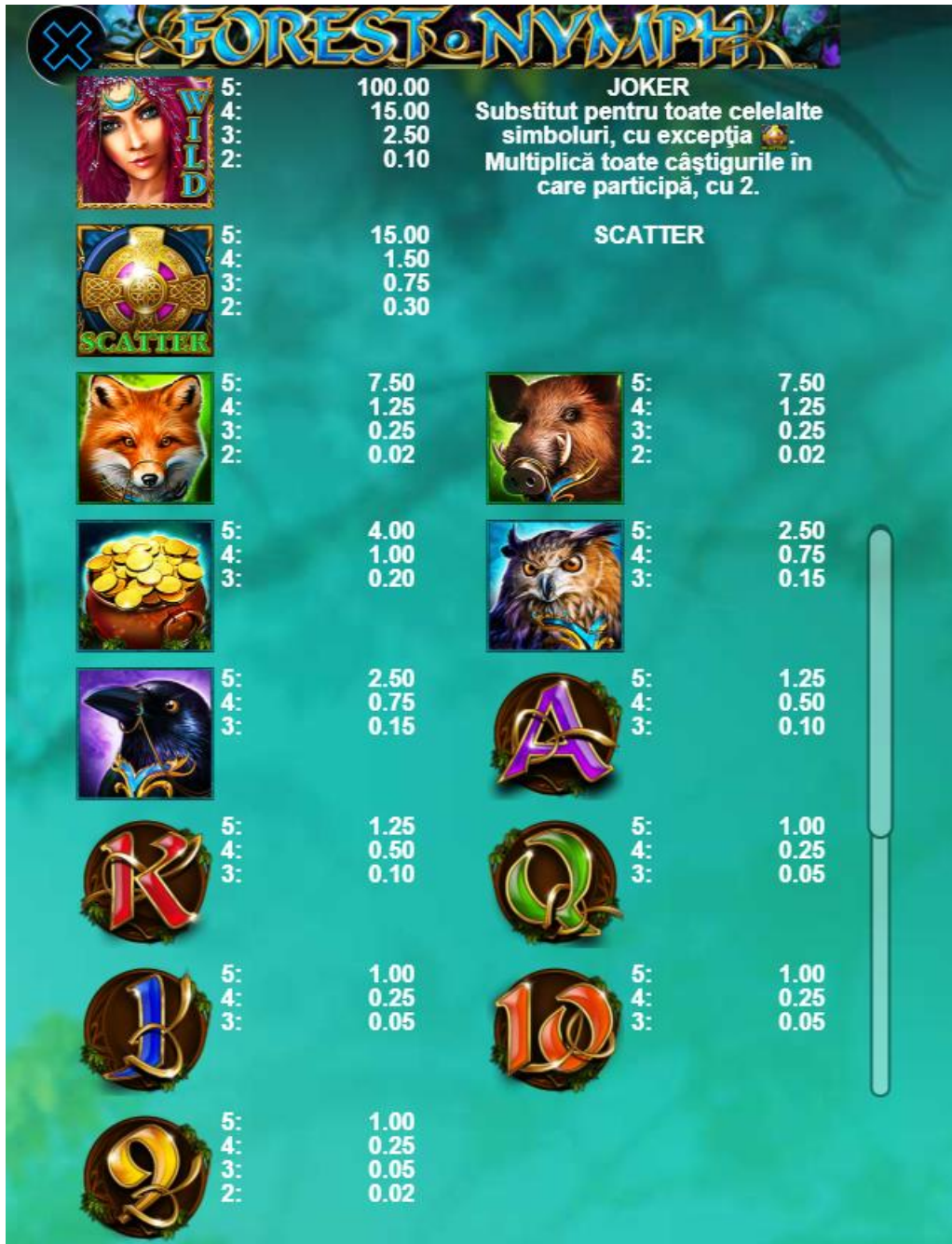
Fig. 2 Tabelul câștigurilor