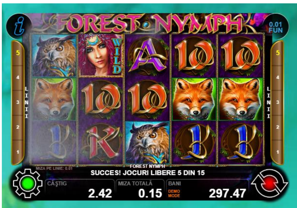
Fig. 3 Ecranul jocului gratuit

Jocuri gratuite – 3, 4 или 5 simboluri scatter „Cruce” declanșează 15 jocuri gratuite. Toate câștigurile în timpul jocurilor gratuite , cu excepția 5 x „Nimfă ” se înmulțesc cu 3. În acest mod pot fi câștigate 15 jocuri gratuite suplimentare.