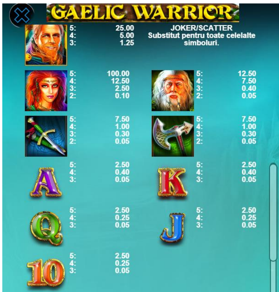
Fig. 2 Tabelul câștigurilor