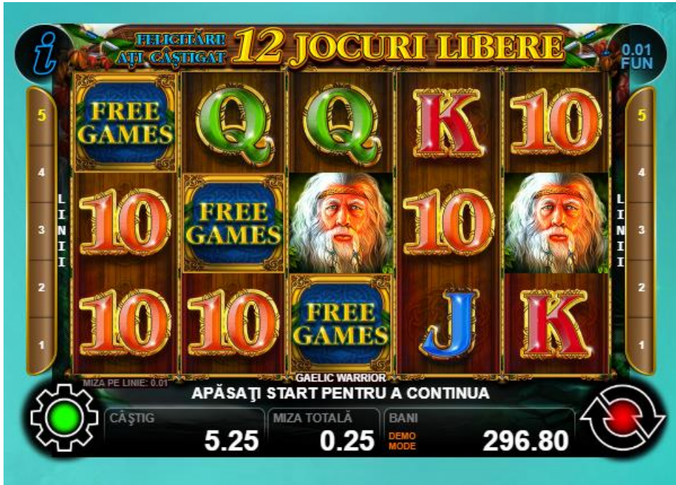
Fig. 3 Ecranul jocului gratuit

Rolele în jocurile plătite și gratuite sunt diferite. Numărul de linii și pariul pe linie în timpul jocurilor gratuite sunt același ca și în jocul plătit, care a declanșat jocurile gratuite. Câștigul maxim pe linie – 5 simboluri „Femeie” (sau simboluri de substituie) pe linia de câștig activă oferă câștigul maxim pentru linie.