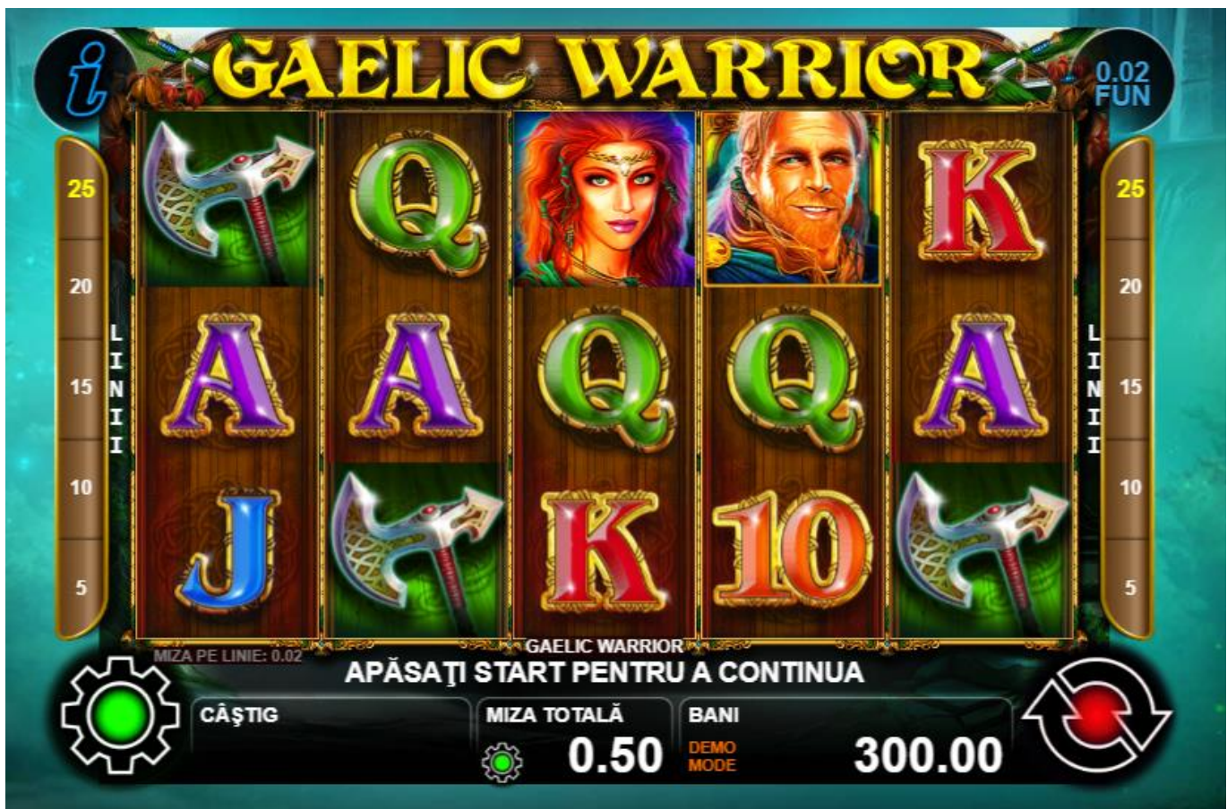
Fig. 1 Ecranul jocului principal

* setat în prealabil în setările jocului