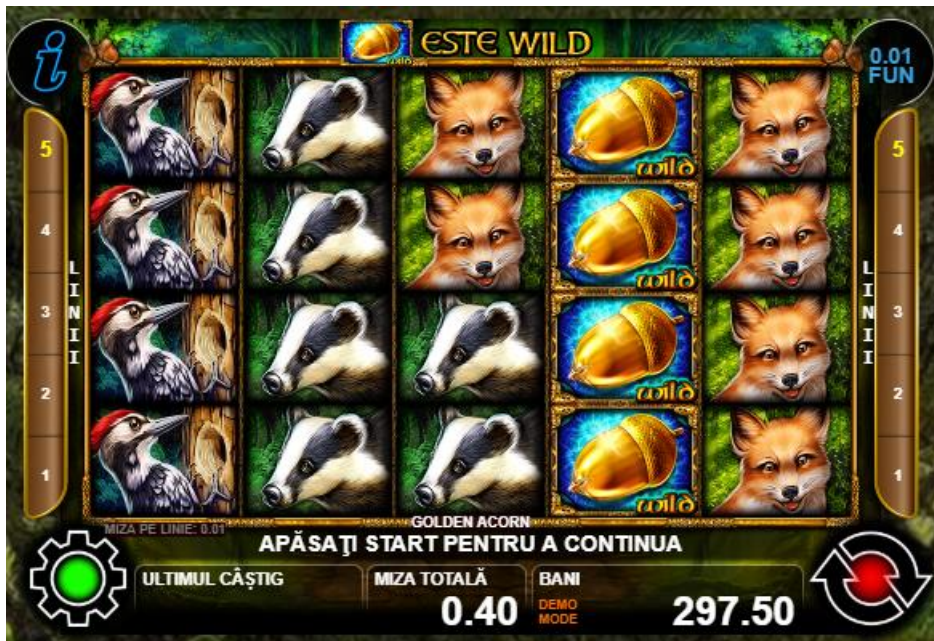
Fig. 3 Câștig cu participarea scatter-ului