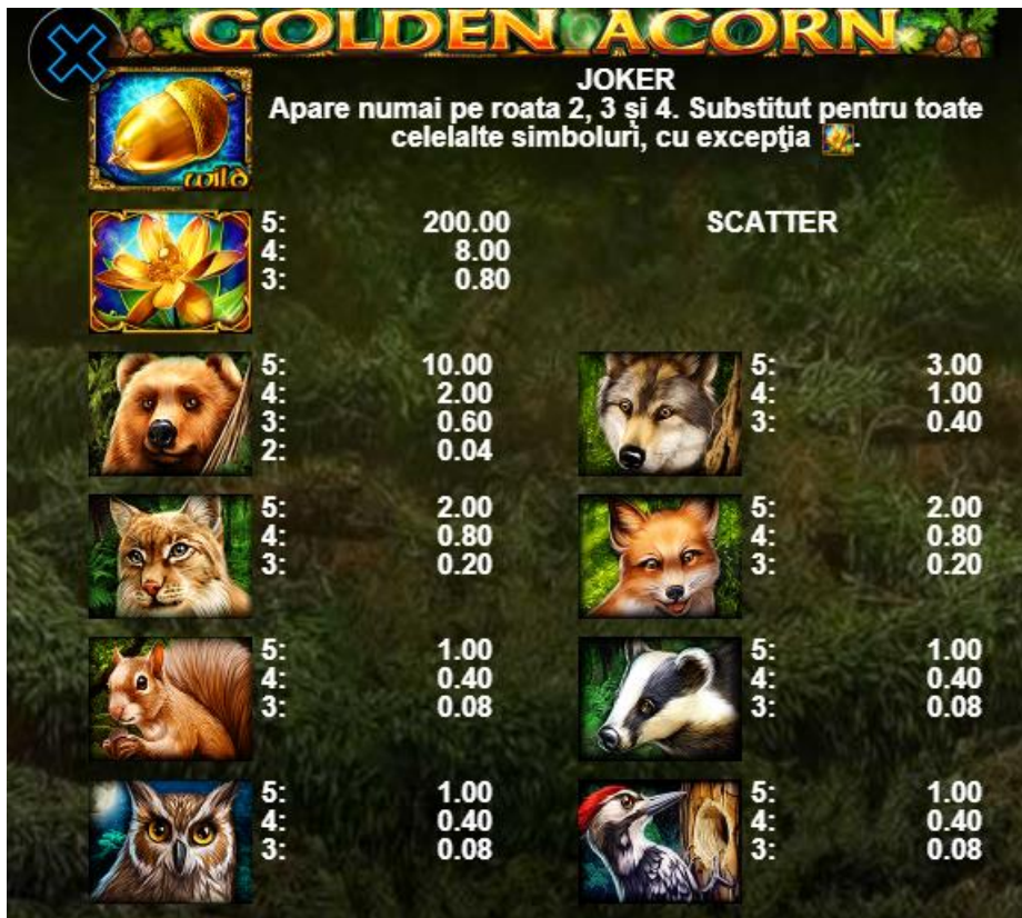
Fig. 2 Tabelul câștigurilor