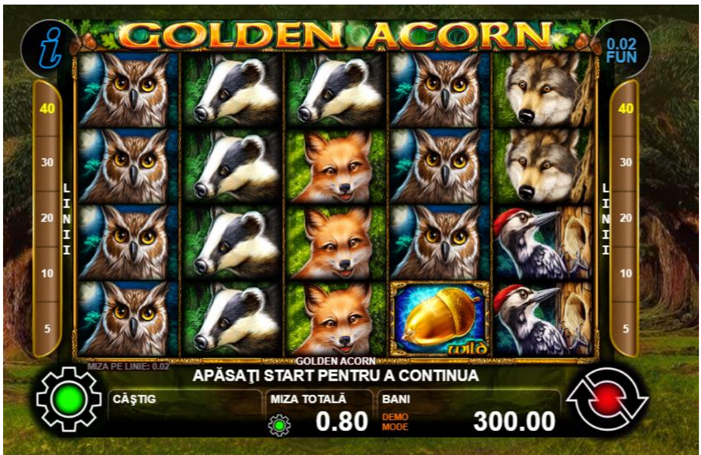
Fig. 1 Ecranul jocului principal