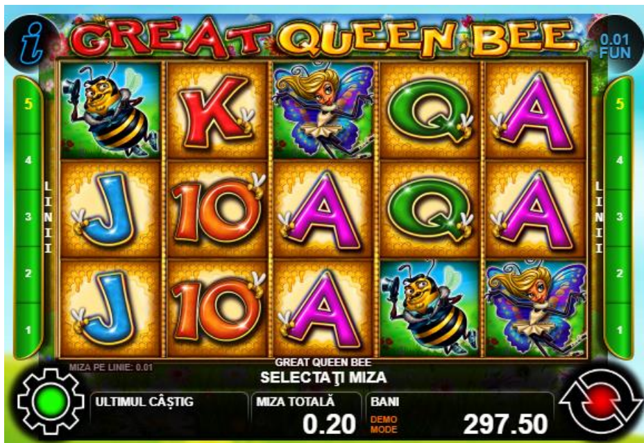
Fig. 1 Ecranul jocului principal

* setat în prealabil în setările jocului