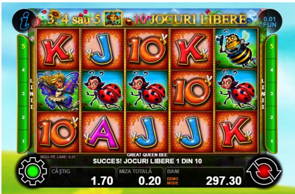
Fig. 4 Ecranul jocului gratuit