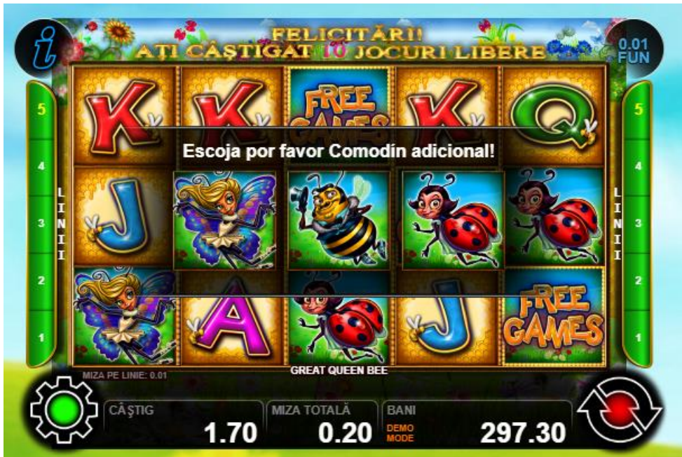
Fig.3 Selectarea simbolului de substituie suplimentar în jocurile gratuite

simboluri, cu excepția simbolului „Albină matcă”.