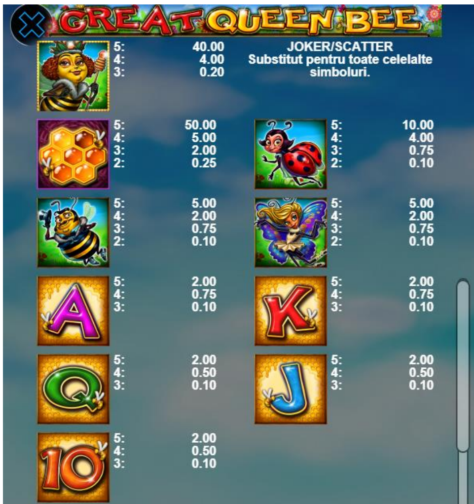
Fig. 2 Tabelul câștigurilor