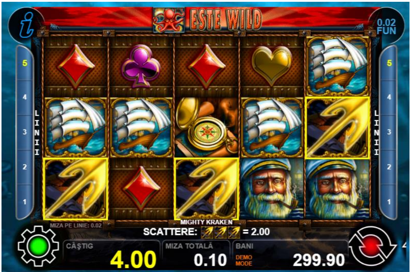
Fig.3 Jocul principal și câștigul scatter