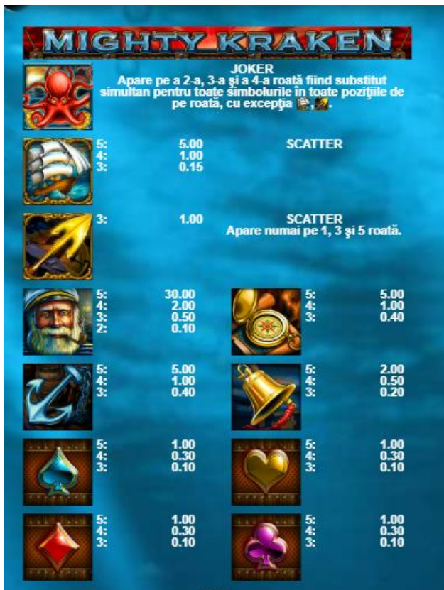
Fig. 2 Tabelul câștigurilor