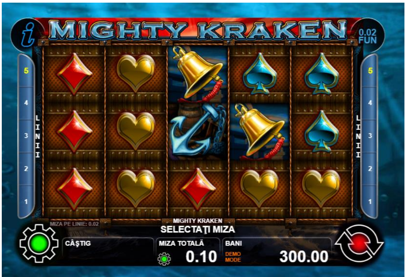
Fig. 1 Ecranul principal al jocului cu simboluri de înlocuire de tip "Expanded"