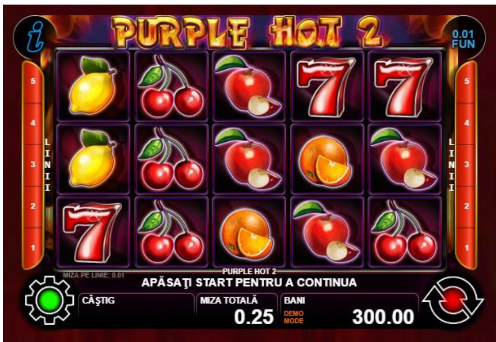
Fig. 1 Ecran al jocului principal