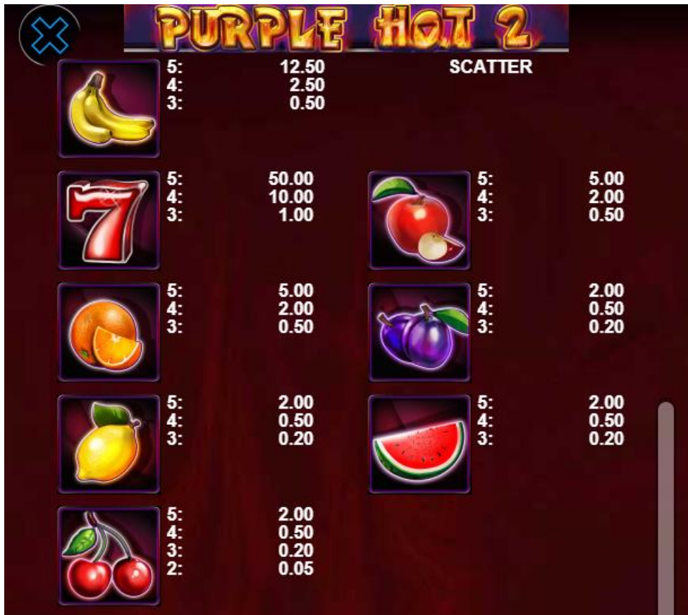
Fig. 2 Tabelul câștigurilor